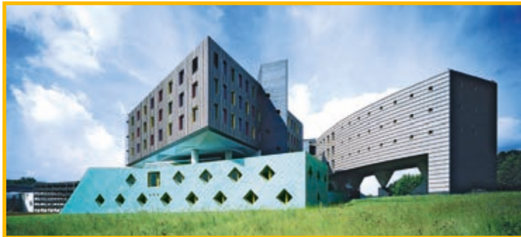
Die Konzernzentrale im hessischen Melsungen